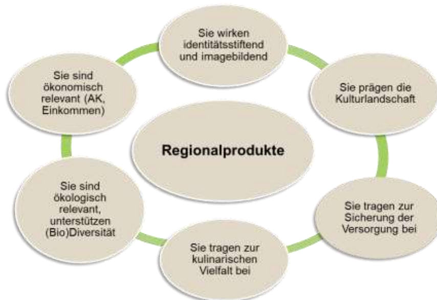
Abbildung 1: Regionalprodukte - Lebensmittel regionaler Herkunft mit Gemeinwohlleistungen

dass die Wertschöpfungsprozesse zur Verarbeitung von Agrarprodukten zu Lebensmitteln weit überwiegend innerhalb der Metropolregion und den unmittelbar angrenzenden Landkreisen erfolgt.