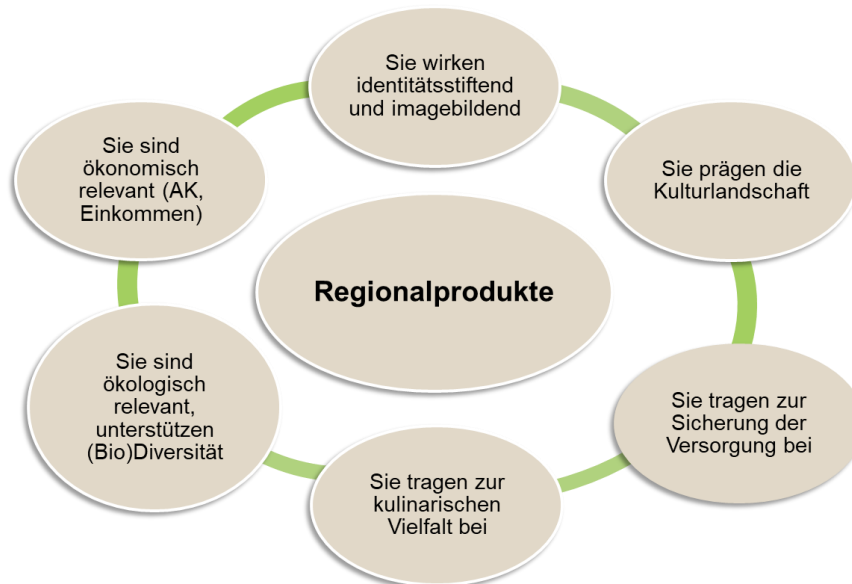
Abbildung 1: Regionalprodukte - Lebensmittel regionaler Herkunft mit Gemeinwohlleistungen

dass die Wertschöpfungsprozesse zur Verarbeitung von Agrarprodukten zu Lebensmitteln weit überwiegend innerhalb der Metropolregion und den unmittelbar angrenzenden Landkreisen erfolgt.