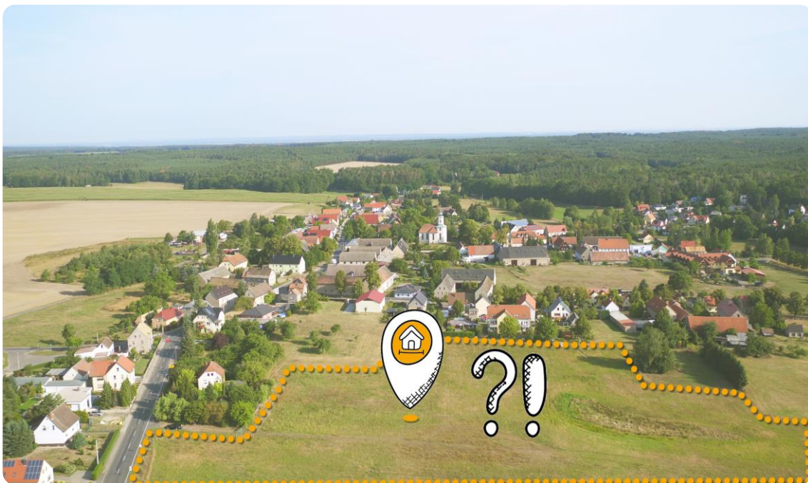
Abbildung 3: Welche kulturlandschaftlichen Anknüpfungspunkte wären hier denkbar? (TUD 2022)

Hier setzt der zweite Bestandteil kulturlandschaftlicher Betrachtungen an: in einem bis 2021 durch die TU Dresden im Rahmen von StadtLandNavi erarbeiteten Kulturlandschaftskonzept für die Planungsregion Leipzig-West Sachsen (Schmidt et al. 2021) erfolgte eine Vielzahl von Analysen und Bewertungen. Diese beinhalten das Herausstellen von besonderen Einzelementen der Kulturlandschaft, die Gliederung der Planungsregion in Kulturlandschaftsräume, aber auch die Betrachtung der Auswirkungen und Folgen des Klimawandels. Eine große Anzahl dieser Untersuchungen lässt auch Rückschlüsse auf etwaige neue Wohnbauflächen zu und es bietet sich so die Möglichkeit, Synergien zu finden, bevor eine eigentliche Projektierung der potenziellen Wohnbauflächen startet (s. Abb. 3). Oder anders formuliert: es bietet sich so die Möglichkeit, neue Bestandteile der Siedlungslandschaften verträglich mit der Kulturlandschaft zu gestalten!